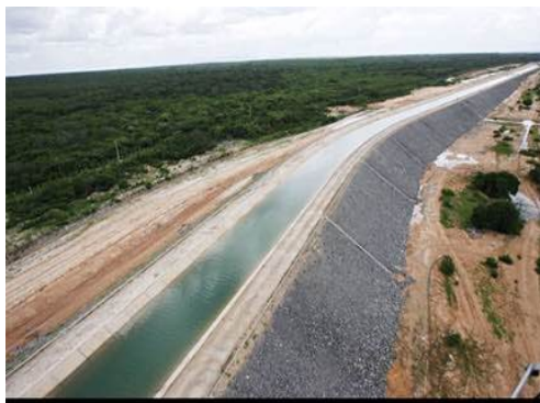
1º. Trecho Jati / Rio Cariús Avanço Físico Total = 25,3%

Lote 1 – 47,9% Lote 4 – 3% Lote 2 – 22% Lote 5 – 53% Lote 3 – 19%