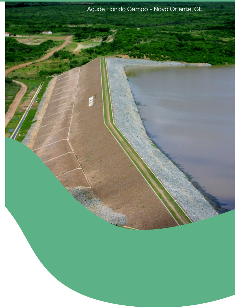
Açude Flor do Campo - Novo Oriente, CE