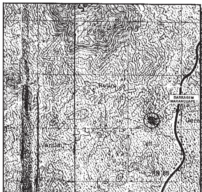
SECRETARIA DOS RECURSOS HÍDRICOS LOCALIZAÇÃO DO AÇUDE PÚBLICO MARANGUAPE I BACIA METROPOLITANA

ANEXO ÚNICO A QUE SE REFERE O PARÁGRAFO ÚNICO DO ARTIGO 1º DO DECRETO Nº26.582, DE 22 DE ABRIL DE 2002.