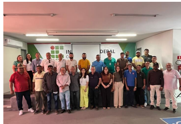
83ª Reunião Ordinária da Sub-Bacia do Rio Banabuiú OUT/2024