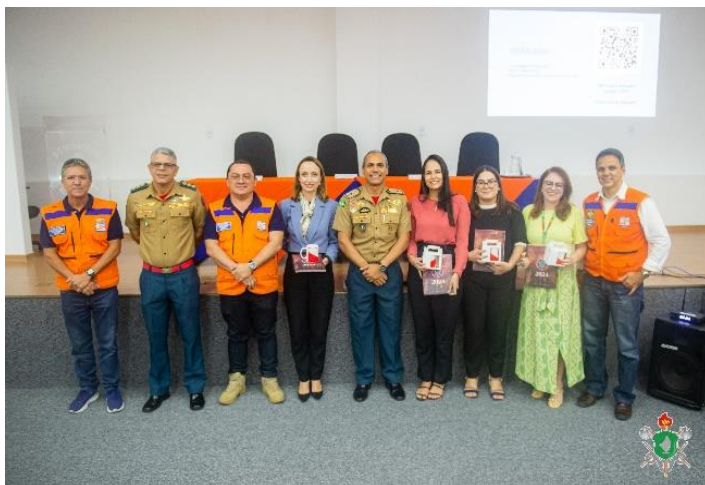
Curso: Fortalecimento da Gestão de Risco de Desastres e Segurança de Barragens - FEV/2024